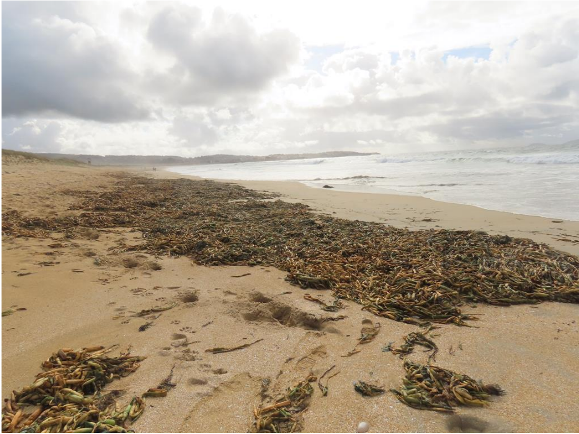
Foto 3. Arribazón de toneladas de xacintos acuáticos, de orixe probablemente portuguesa (pola presenza maioritaria de lixo desta orixe mesturado coas plantas), con data 6 de novembro de 2022.