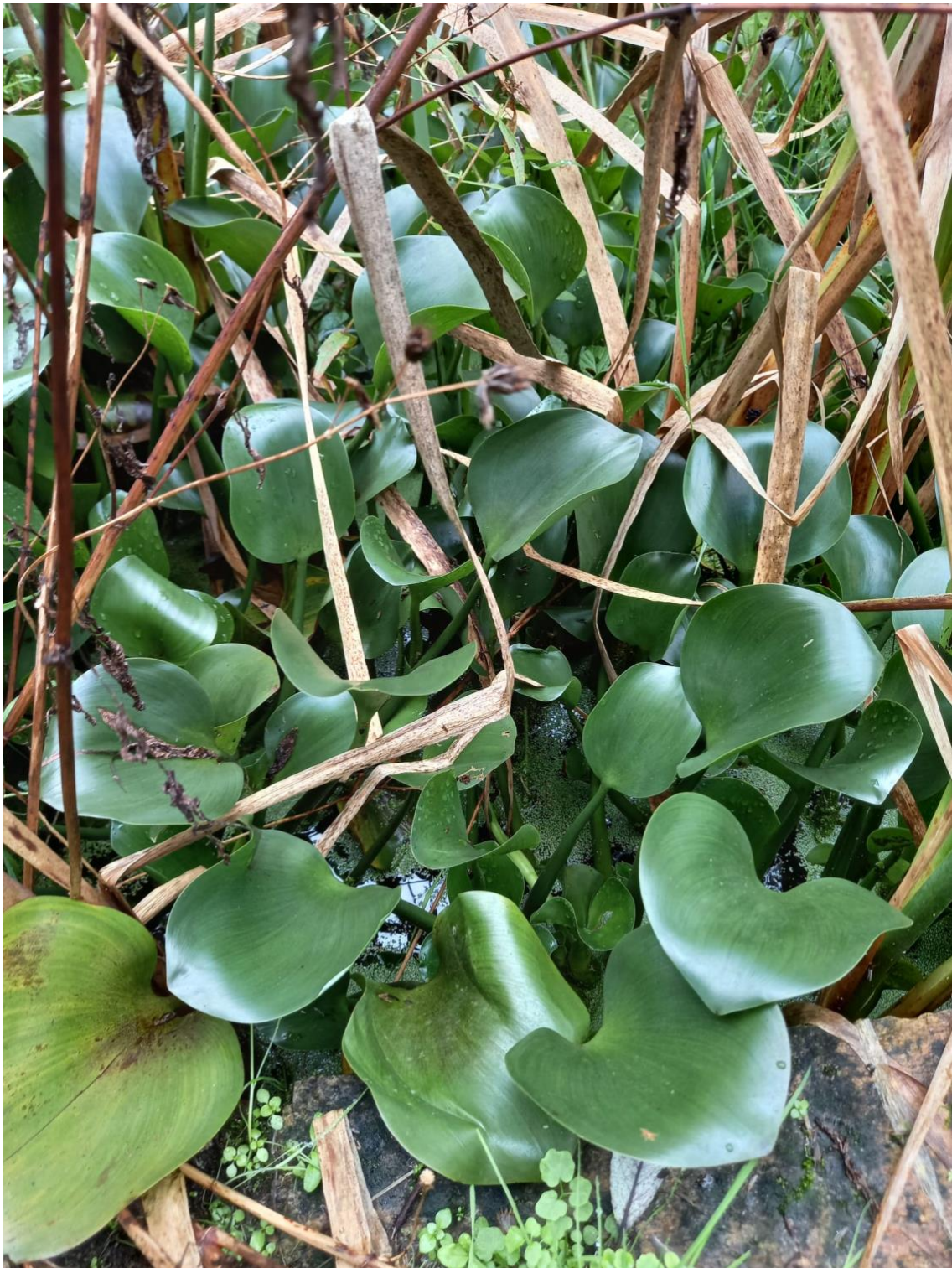
Foto 4. Xacinto acuático fotografado o 14 de novembro de 2022 no rego de Trabe, en Vilaboa (concello de Culleredo).