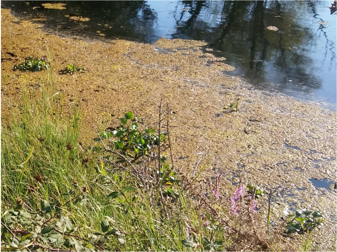
Foto 2. Aspecto das masas espaxadas na beira da lagoa das Cachadas, Rouxique, Sanxenxo, con data 7 de agosto de 2018.